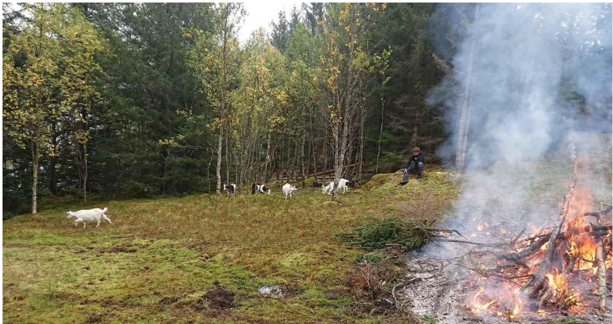
Figur 1. Bildet viser opprydding etter felling av sitkagran på Lauklinesøya i Kattfjord. Rester av kvisting brennes, og geit brukes for å ta ettervekst og åpne i krattskog.

Kommunen ønsker å prioritere tiltak som åpner opp og restaurerer gamle slåtte- og beitemarker. Et godt tiltak er for eksempel konsentrert beite ved bruk av no-fence teknologi. Det må være knyttet tydelige samfunns-, kultur- eller naturverdier til området som skal åpnes opp. Eksempel kan være at det er i områder med betydelig interesse for allmenn ferdsel, områder med kulturminner og/eller naturverdier som trues av gjengroingen.