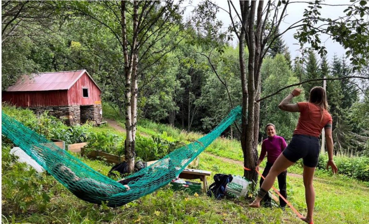
Figur 4. Bildet viser tilrettelegging for allmenheten ved Kaldslettstien i bynært kulturlandskap. Det har blitt innvilget SMIL-midler for å utarbeide en skjøtselsplan for området.