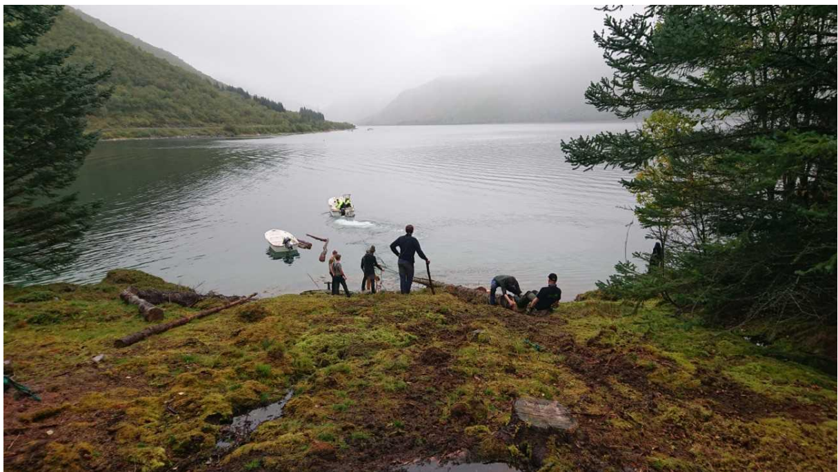
Figur 2. Bildet viser utskipning av ryddet sitkatømmer på Lauklinesøya i Kattfjord.

Det særpregede naturmangfoldet i Tromsø kommune trues av fremmede arter. I de bynære områdene er det spesielt tromsøpalmen som etablerer seg på innmark som ligger brakk. På yttersida er det plantet gran, til stor del utenlandsk sitka- og lutz-gran, som ikke er naturlig i området og som i dag er nesten uten økonomisk verdi. Slike forekomster kan true artsmangfoldet, og er et fremmet element i både kultur- og naturlandskapet. Etersom fjerning av fremmede arter er konkrete tiltak med god effekt for både artsmangfold og kulturlandskapsbildet, vil kommunen prioritere søknader som planlegger dette.