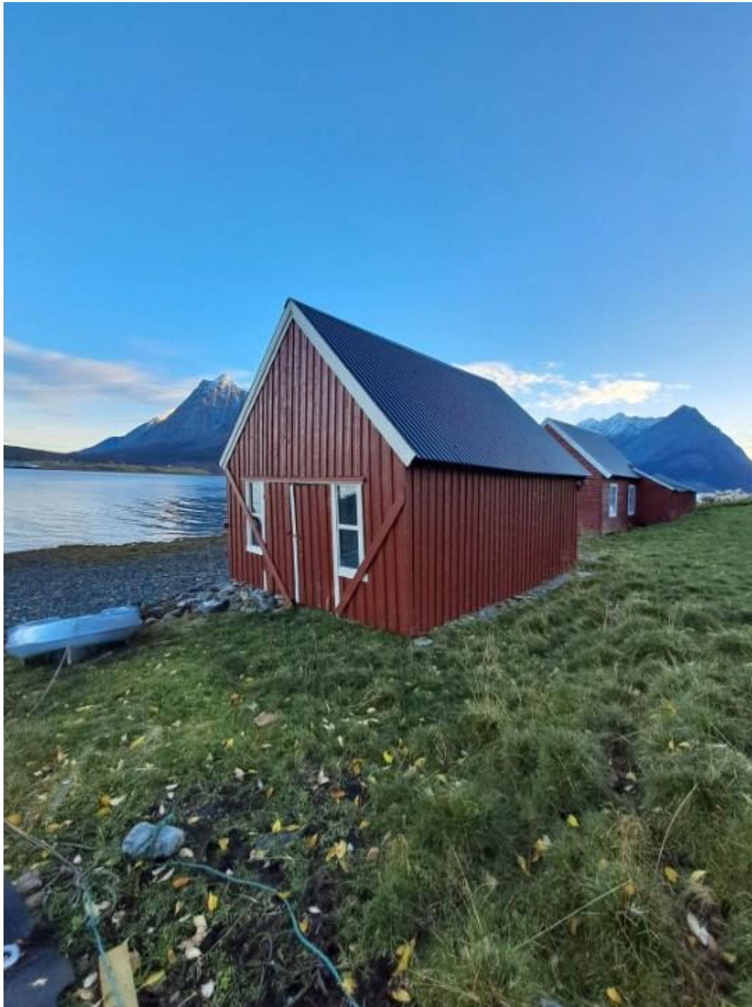
Figur 3. Bildet viser et restaurert naust i Jøvik. Naustet står ved siden av et restaurert verkstedbygg, og knytter eksisterende gårdsmiljø til den gamle fiskerbonde-drifta. Naustet brukes til å oppbevare nordlandsbåt og tradisjonelle redskaper.

Målet er å ivareta bygninger og anleggets kulturhistoriske verdi ved at kulturminnet settes i stand etter antikvariske prinsipper, i tråd med faglige råd fra regional kulturminneforvaltning.