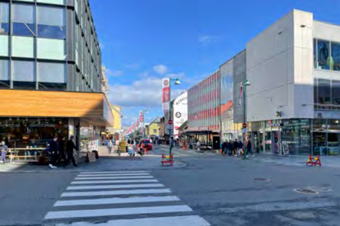
Oversiktsbilder av dagens situasjon; Kunstprosjekt 1: utenfor Storgata 70/72 og 74 ved krysset Storgata - Fredrik Langes gate