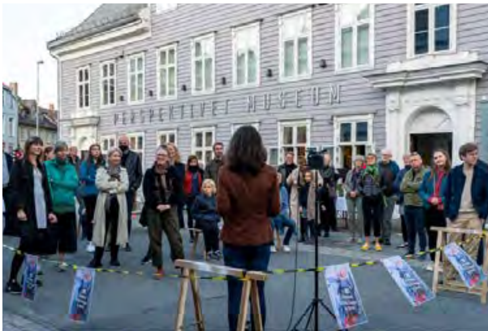
Bildetekst: Perspektivet Museum har brukt Storgata til arrangementer, her åpning av veggmaleri av Cora Sandel av WOW.