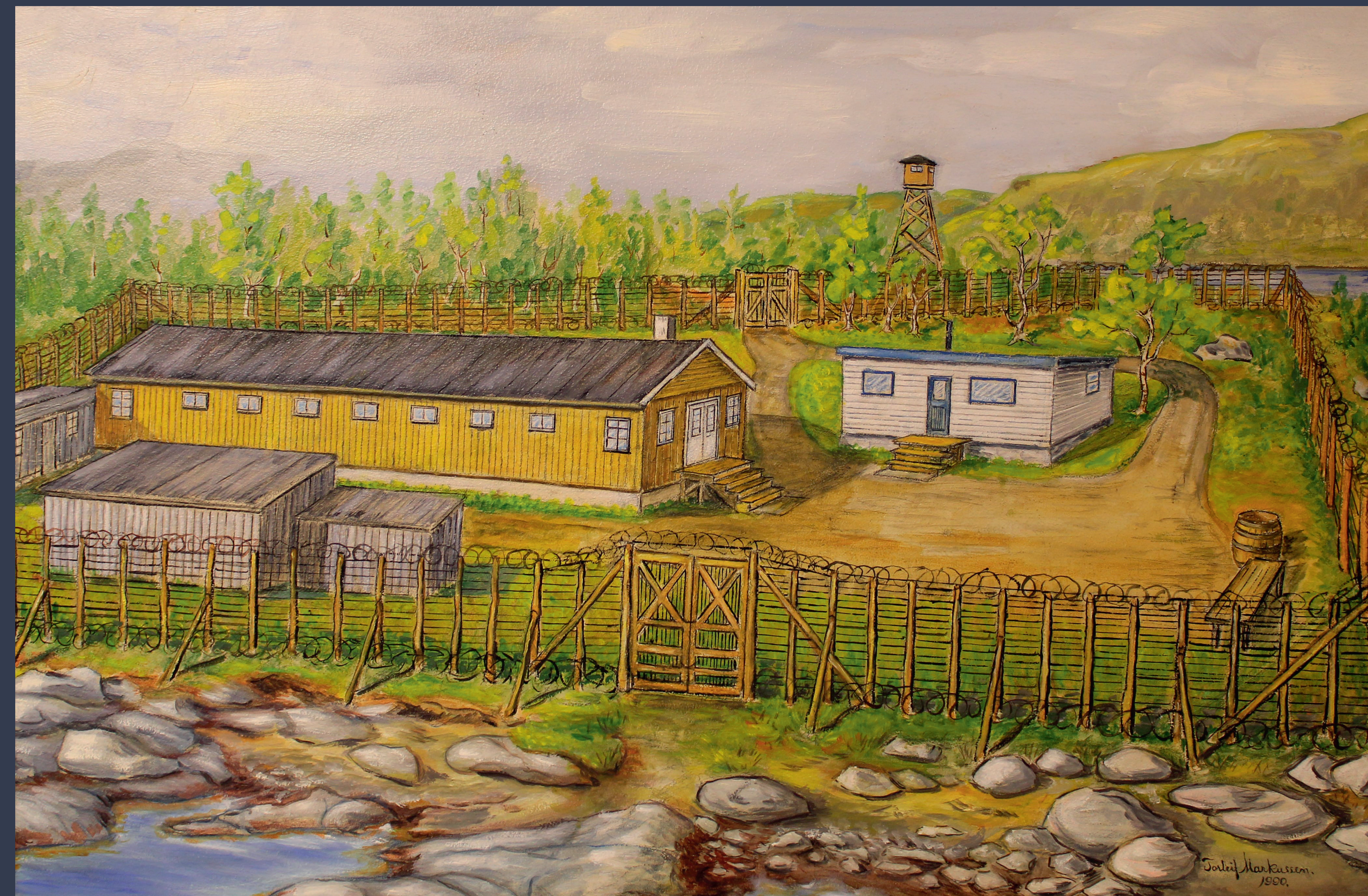
🇬🇧 Sydspissen fangeleir malt i 1990 av Torleif Markussen. Han var fange der i 1942. Det finnes ingen kjente fotografier av Sydspissen fangeleir. Maleriet viser blant annet offisersboligen som fortsatt står i området. Den er nå bolig.

Only remnants of the camp remain, as can be seen on the map.