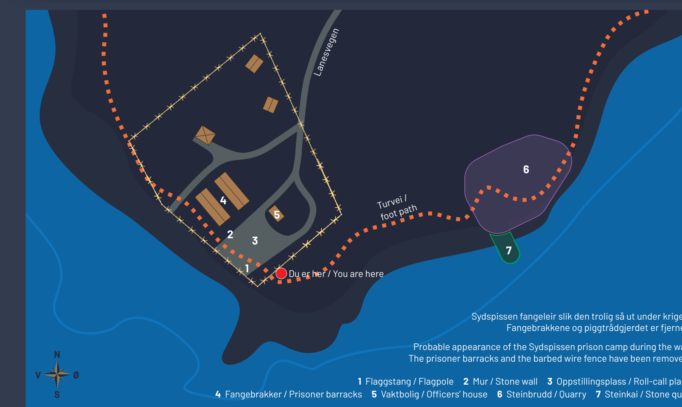
Sydspissen fangeleir slik den trolig så ut under krigen. Fangebrakkene og piggtårdgjerdet er fjernet.